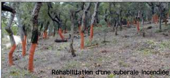
Réhabilitation d'une suberaie incendiée

L'Association Syndicale Libre de Gestion Forestière de la Suberaie Catalane.