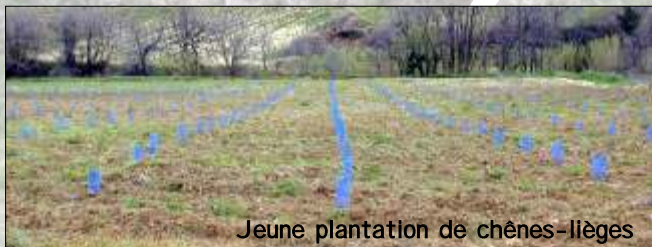
Jeune plantation de chênes-lièges