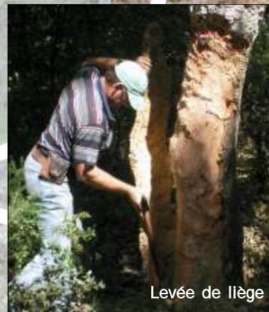
Levée de liège